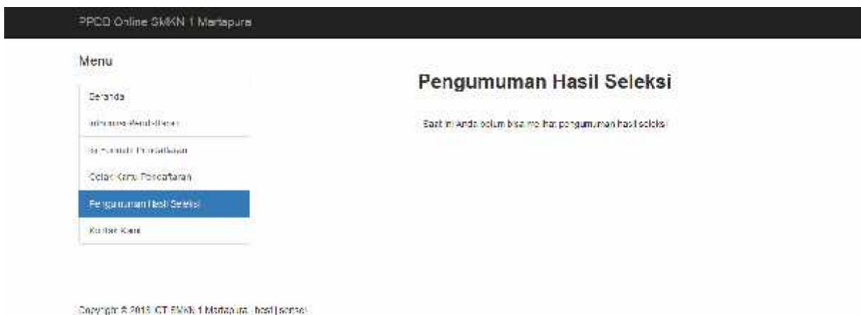
Gambar 5. Tampilan Pengumuman Hasil Seleksi

Menu “pengumuman hasil seleksi” adalah berisi hasil akhir seleksi calon peserta didik baru yang diterima di SMK Negeri 1 Martapura.