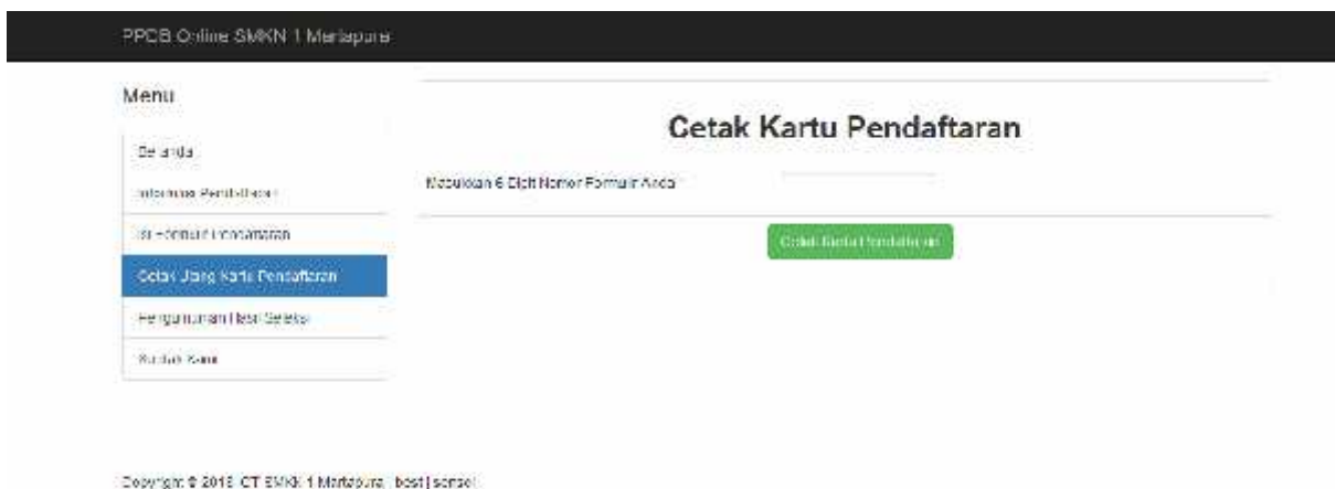
Gambar 4. Tampilan Cetak Ulang Kartu Pendaftaran

Menu “cetak ulang kartu pendaftaran” merupakan fitur untuk mencetak ulang kartu pendaftaran. Untuk mencetak ulang kartu pendaftaran melalui fitur ini, calon peserta didik cukup memasukkan no. formulir pendaftaran yang diperoleh saat mendaftar secara online.