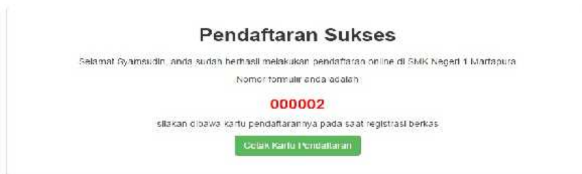
Gambar 13. Pendaftaran Sukses