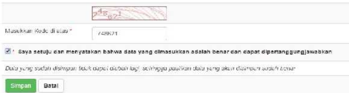
Gambar 12. Captcha dan Persetujuan