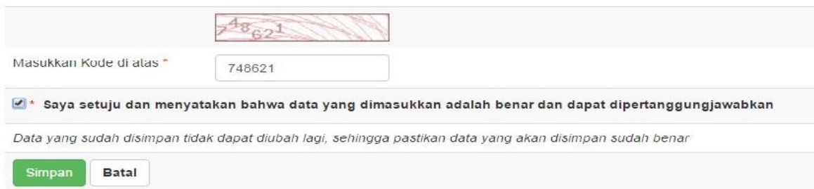
Gambar 12. Chapta dan Persetujuan