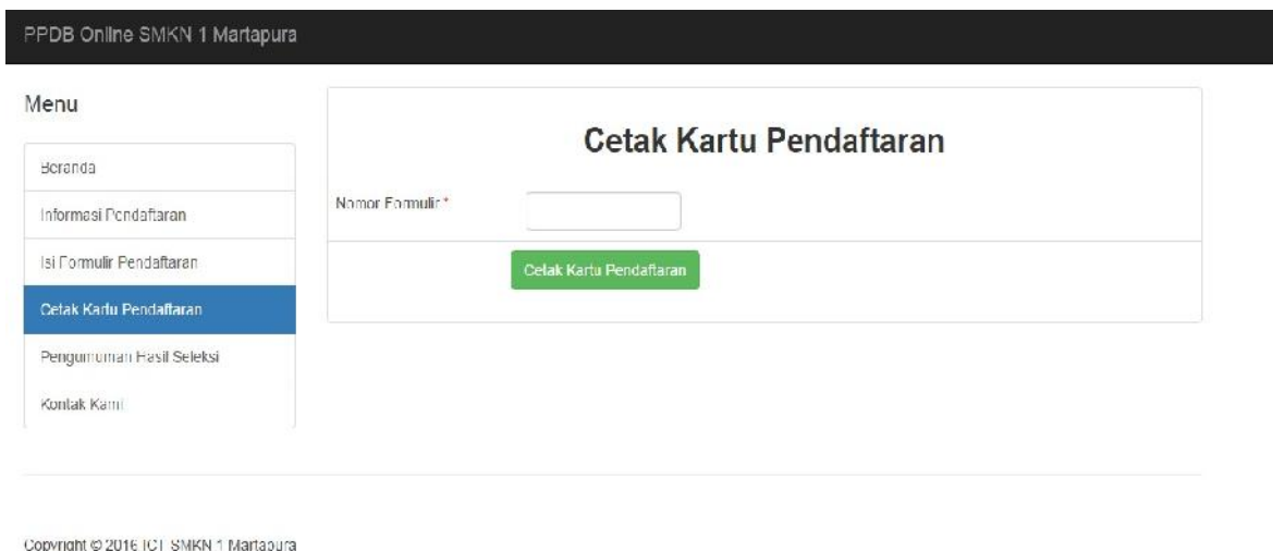
Gambar 4. Tampilan Cetak Kartu Pendaftaran