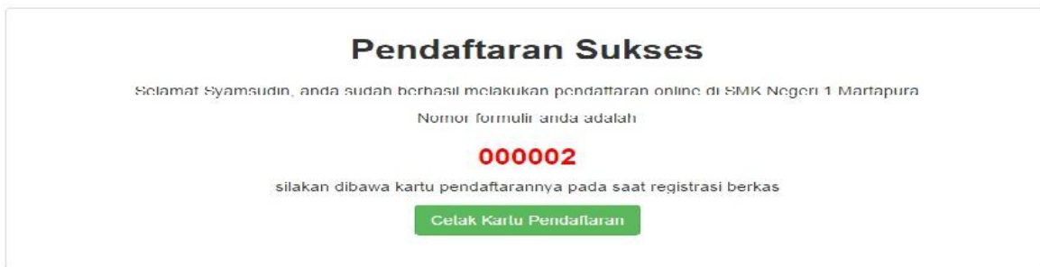
Gambar 13. Pendaftaran Sukses