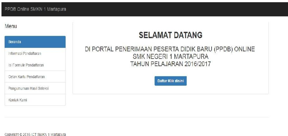
Gambar 1. Tampilan Home Sistem Informasi PPDB Online

Tampilan menu “beranda” pada Portal Sistem Informasi Penerimaan Peserta Didik Baru Online SMK Negeri 1 Martapura adalah sebagai berikut.